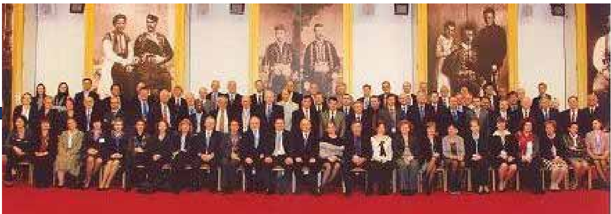
Asambleja Gjenerale e 26 e EA, 24-25 Nëntor 2010, Budvë - Mali të Zi 26 EA General Assembly, November 24-25, 2010 Budva, Montenegro International relations of DAK

Ky status i anëtarësimit DAK-ut i jep të drejtën jo vetëm të marrë pjesë në aktivitetet e Organizatës Ndërkombëtare të Akreditimit të Laboratorëve- ILAC dhe Forumin Ndërkombëtar të Akreditimit (IAF) por edhe të votojë për çështje të ndryshme lidhur me procedurat e akreditimit. Anëtarësimi në këto forume ndërkombëtar është vazhdimësi e objektivave që DAK i ka vënë vetes për tu bërë pjesë e rrjetit ndërkombëtar dhe evropian të organizmave të Akreditimit.